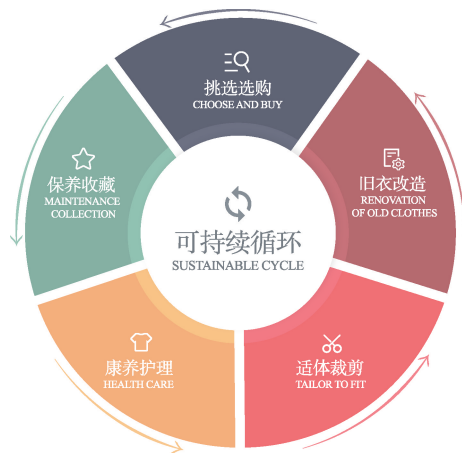
图3 改革开放初期服装杂志中的中国服装可持续闭环

与使用的角度,发表了大量相关文本讯息,分别从服装的挑选选购、保养收藏、康养护理、裁剪改造方面,展现了中国服装环保节约的使用方式,见图2。值得强调的是,当时人们对于服装此类使用方式的宣传与推介,不仅完整地包含了服装由“诞生”走向“消亡”的整个生命过程,而且从微观的视角观察并走进人们的生活,分门别类地给出了服装的使用与保养的具体方式,使其中“可持续”的设计使用理念逐渐浮出水面,区别并规避了以往及当下一般宏观性、口号式的理论呼吁,具有重要的时代引领价值与生活实践指导意义。从服装设计生产后的选购,到服装穿着过程中的养护,再到服装破旧或落伍后的改造,服装杂志中对于服装相关对策经验的阐释,全面包含了服装使用过程中的各个阶段。换言之,人们通过对各阶段服装在杂志文本学习实践之后,最终形成了可持续的完整闭环,见图3,构建了一个良性的循环系统。