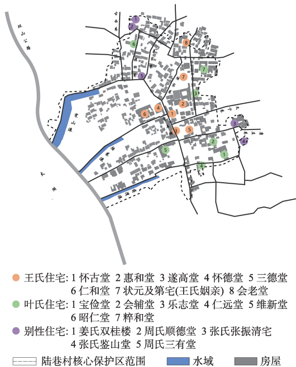
图4 陆巷村平面布局

持于这种自由状态,即把每件事都保护在其本质之中,居住的基本特征就是这种保护,它贯通了居住的整个范围 [3] 。农耕生产方式及较为封闭的地理环境决定了中国人偏于内倾、保守向的性格特征,因而也更注重居住环境的心理安全性即其对于生命的有效保护,将背山面水、有所围护的自然环境视为可以安居的洞天福地。