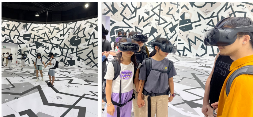
图3 消失的法老——胡夫金字塔沉浸式探索体验展

由日本 TeamLab 艺术创作团队推出的 TeamLab Borderless 新媒体艺术展,该展览采用了混合现实技术,通过数字互动设施创造了一个美妙而奇幻的数字梦境。艺术家融合了光影、声音和影像等多种元素,使参观者能够全身心地沉浸在艺术的空间中。这种全新的观展方式通过数字技术的运用,使观众能够更直接、更深刻地体验艺术,超越了传统艺术展览的局限性,为艺术欣赏提供了一种更为丰富的体验方式。例如,第一展区的作品《被追逐的八咫鸟》采用360°半球形影像装置,通过三维技术构建了一个立体的世界,观众仿佛融入其中,成为艺术作品的一部分(见图4)。八咫鸟在空中飞翔,它们互相追逐、盘旋,光影勾勒出绚烂的画面,呈现出令人惊叹的三维视觉效果。八咫鸟互相追逐,碰撞后化为美丽的花朵。观众可躺在悬挂的“浮游网巢”上,全程沉浸在作品中,光影氛围和音乐增添了沉浸感,创造了梦幻般的观展体验 [7] 。