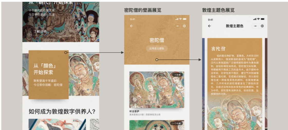
图1 “云游敦煌”小程序界面(图片摘自腾讯CDC)

沉浸式数字文创是利用互联网平台,借助虚拟现实(VR)、增强现实(AR)、人工智能(AI)、计算机图形学(CG)等数字技术,承载互动内容体验的产品和文化创新项目。它注重科技感体验和参与性互动,通过深度融合、加工和创新传统文化和现代文化,来创造出一种新的艺术体验。