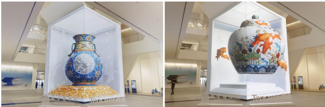
图2 “纹”以载道——故宫沉浸式数字体验展

2023年5月12日,“消失的法老 Horizon of Khufu——胡夫金字塔沉浸式探索体验展”在上海兴业太古汇正式营业,该项目由博新元宇宙、Excurio和HTC Vive联合推出(见图3)。是全球首个对埃及胡夫金字塔内部和周围环境进行扫描勘测和建模还原的新型文旅体验。展览形式主要为VR体验,其中一个独特之处是观者都在一个空间中进行游览,每个人的游览路线都有所不同,但在人与人互相接近的时候,你能够在VR头显的画面中看到有人来到了你的身边。这种体验不仅避免了人与人在VR之中发生的碰撞,还带来了与现实中旅游十分接近的感受——让观众在沉浸于埃及金字塔与古埃及文化的同时,也不断地与其他游客擦肩而过,有效地缓解了VR与他人隔绝的疏离感。而对于展览的主办方来说,这样的设计还形成了一条VR体验的流水线,大大增强了场地的承载能力,能够带来更高的营业收入。