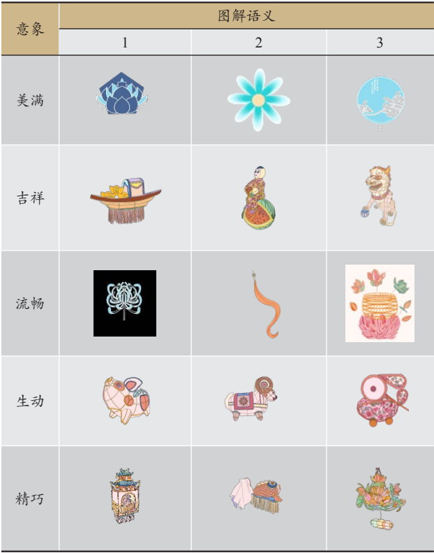
表4 文化语义设计图示

象的图解语义,统计评分结果,由式(5)~(6)图解语义 \overline{V_{tx}} , V_{ty} 的设计价值评价结果,见表5~6。