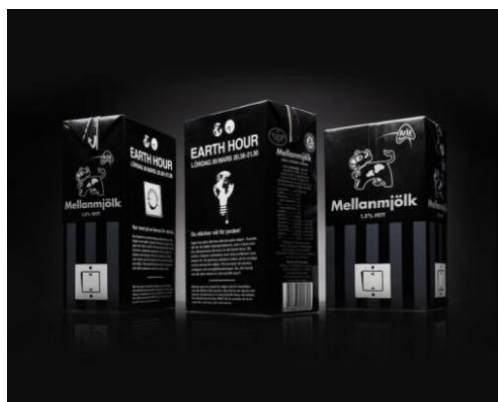
图8 Arla与WWF联名的牛奶包装