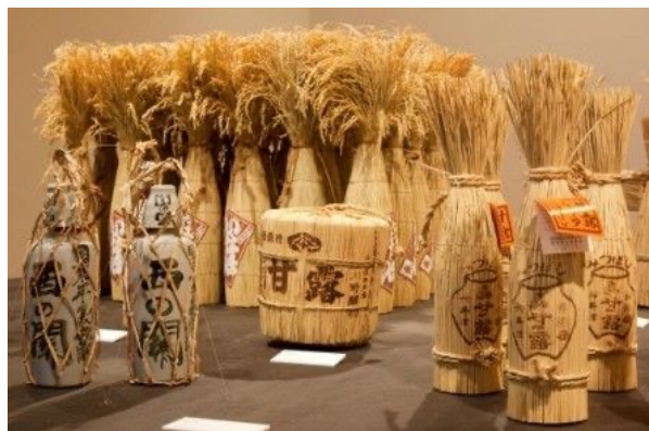
图4 天然材料的酒包装

色环保又极富创意;又如天然材料的酒包装,见图4,选用稻草作为包装材料,生态气息十足,天然环保又给人朴素和谐之感 [13] 。