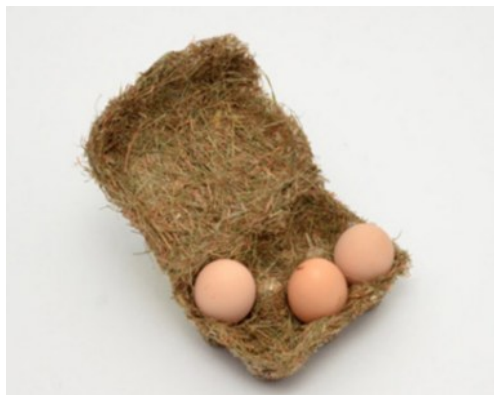
图3 天然材料的鸡蛋包装

天然包装材料是指原生态的包装材料,如植物的茎叶等器官经过加工后可作为天然材料以包装商品。例如天然材料的鸡蛋包装,见图3,该鸡蛋包装取材天然,将原生态的干草加工后作为鸡蛋包装。干草与鸡蛋均为农产品,两相搭配表现出浓厚的纯天然气息,绿