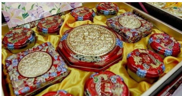
图1 华丽的月饼包装

这些华丽、繁复的商品包装是一种“买椟还珠”式的本末倒置,过度追求“形式主义”,超越了包装设计的