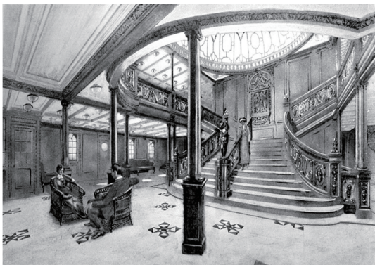
图1 奥林匹克号中庭空间大楼梯

对国际代表性邮轮中庭的大量案例进行数据收集与聚类分析,发现邮轮主题设计主要根据邮轮的客体属性、游客主体需求以及时代环境3个方面来确定。