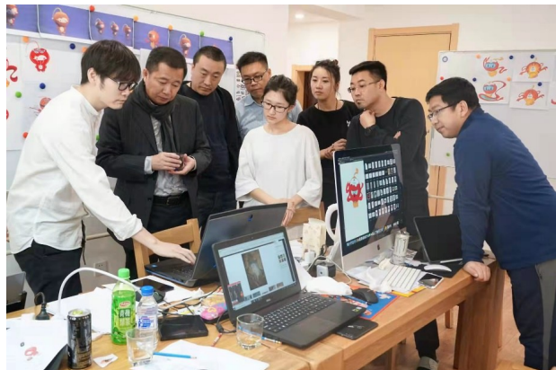
“雪容融”团队在工作室讨论修改设计方案

应该说，“雪容融”从初稿到定稿，变化是巨大的、是颠覆性的。项目初始，冬奥组委对修改灯笼形象也