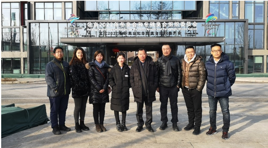
第一次去北京冬奥组委会汇报方案团队合影

没有足够的信心,不知道它会发展成什么样。因为在历届冬奥会吉祥物中,没有一个纯粹的物件来作吉祥物形象的历史。