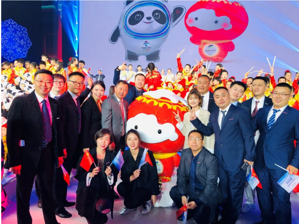
2019年9月17日“雪容融”设计团队在北京2022年冬奥会冬残奥会吉祥物全球发布现场

务,因保密因素,决定自行完成模型制作。两次模型递交后,接到冬奥组委反馈:模型制作精良,望能够尝试更多领域的拓展应用。