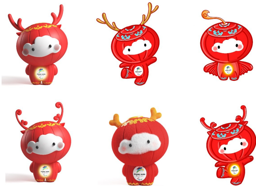
“雪容融”阶段性设计方案