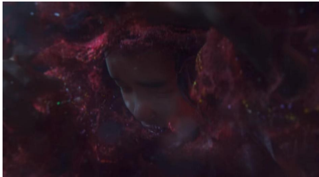
图6 参宿被丧气鬼缠绕