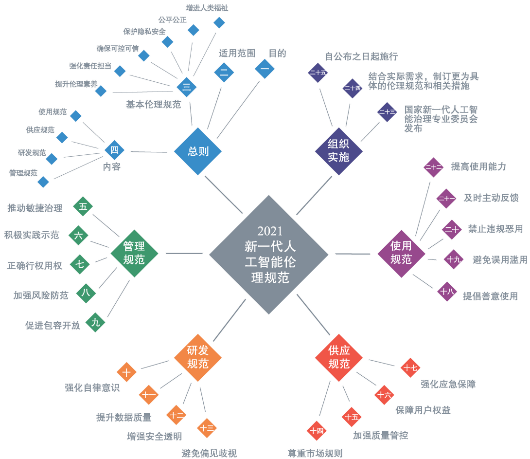
图2 人工智能伦理规范

与之而来的设计伦理问题也日益凸显。相较于传统工业产品,人工智能产品具有更加复杂的伦理风险。大泽博隆等 [14] 系统地阐述了人与智能体交互的研究范畴和研究动向,并以医疗陪伴等应用场景为例进行论述。陈剑 [15] 认为需要在人工智能产品设计阶段确定设计伦理向度。