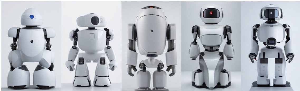
图3 AIGC生成老龄护理机器人外观

要点, 还要深入分析这些伦理设计如何引发伦理风险, 并针对性地提出解决策略。本研究旨在通过对现有伦理风险的分析, 提出具体的设计对策, 具体分析如下。